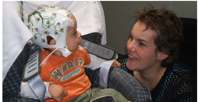
EEG onderzoek: omdat het hier een luister onderzoek betrof, kon de baby vrolijk naar zijn moeder kijken.

kinderen die relatief meer woorden begrepen juist diegene waren die in hun hersengolfjes een groter effect lieten zien van woordherkenning, terwijl kinderen die relatief minder begrepen dit effect niet lieten zien. We concludeerden dat deze taak van woordherkenning redelijk moeilijk was voor baby's van 10 maanden. Nog niet alle baby's konden dit. De taalontwikkeling van kinderen is immers ook variabel: sommige kinderen zeggen hun eerste woordjes al vanaf 8 maanden, maar anderen pas rond 15 maanden. Verder bleek uit dit onderzoek dat het vermogen om woorden te herkennen als deze eerder in een zinnetje voorkwamen gerelateerd is aan latere taalontwikkeling.