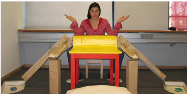
Waar is het nu gebleven?

Eén van de grootste prestaties van baby's is leren om te gaan met andere mensen. De meest duidelijke vorm van communiceren is praten. Er zijn echter ook andere vormen van communiceren, zoals wijzen. Op het moment dat kinderen kunnen praten, kan er ook echt verteld worden hoe men, in deze cultuur, omgaat met elkaar. Maar om te leren praten, moeten baby's allereerst al wat vaardigheden hebben om op andere mensen te reageren. In de Communication Before Language Groep onderzoeken we welke vormen van communiceren baby's tot twee jaar gebruiken om contact te leggen met hun omgeving. Hoe communiceren baby's doorgaans met hun verzorgers en omgekeerd? Begrijpen baby's wat er in een persoon omgaat als die op iets reageert of iets doet? Hoe begrijpen baby's wat andere mensen denken of doen? Hoe gaan ze reageren op hun omgeving, zonder te praten? Tenslotte vragen wij ons af of er culturele verschillen zijn in hoe ouders met hun niet-talige baby's communiceren. Door het beantwoorden van deze vragen krijgen we hopelijk meer inzicht in het unieke fenomeen van communicatie bij mensen, en van onze kleine baby's in het bijzonder.