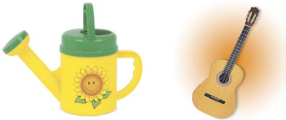
Gieter of gitáar ?

Het begin van sommige woorden lijkt erg op elkaar: bijvoorbeeld het begin van de woorden koning en