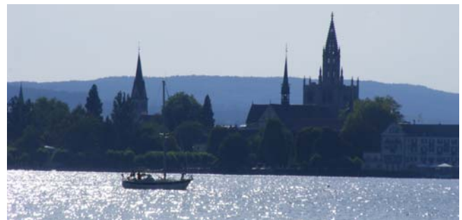
De Bodensee bij Konstanz