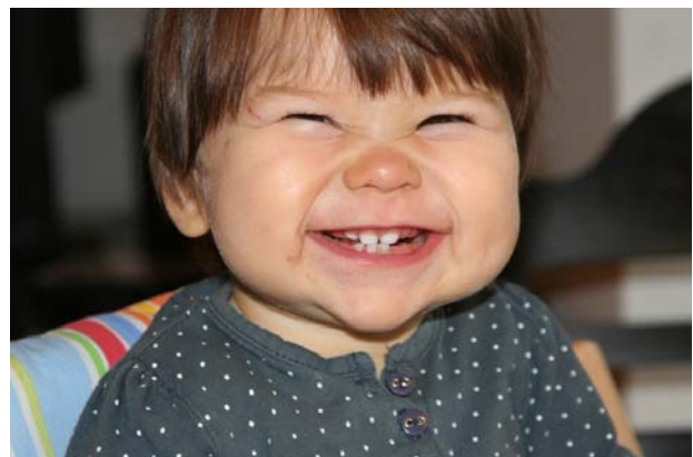
In het BRC bestuderen we veel aspecten van de ontwikkeling van baby's